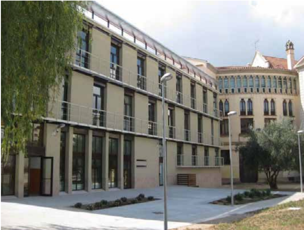
IES LLUIS PEGUERA. MANRESA.