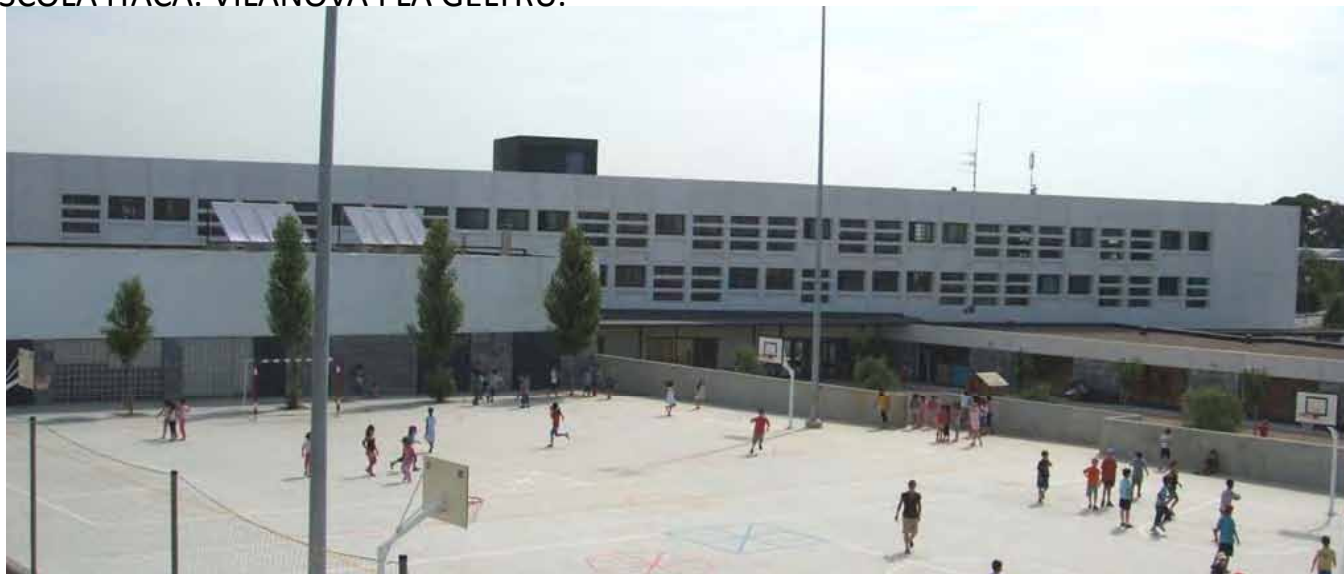
ESCOLA ITACA. VILANOVA I LA GELTRU.