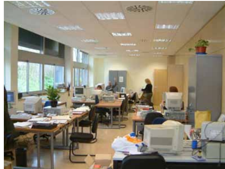
LA BISBAL D'EMPORDÀ